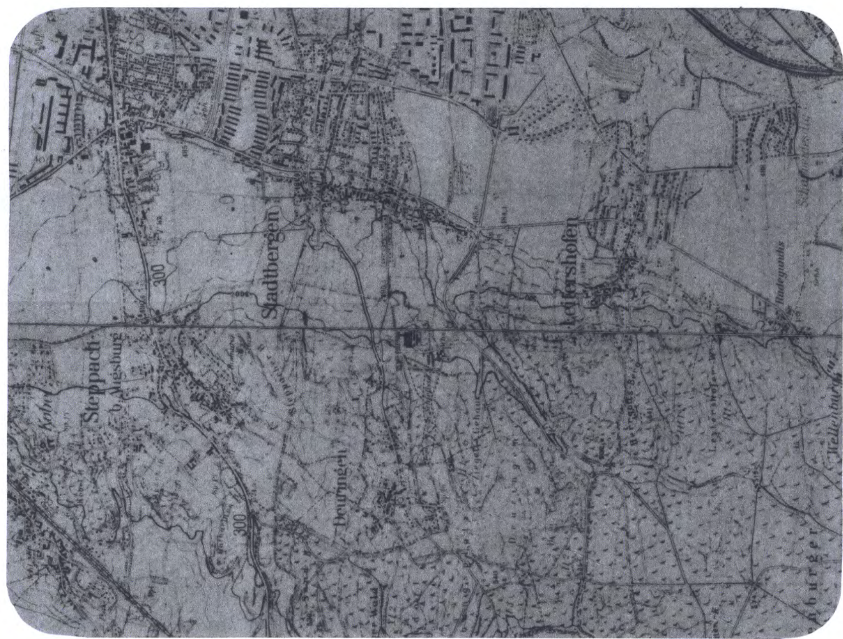
Übersichtsplan 1 : 25000