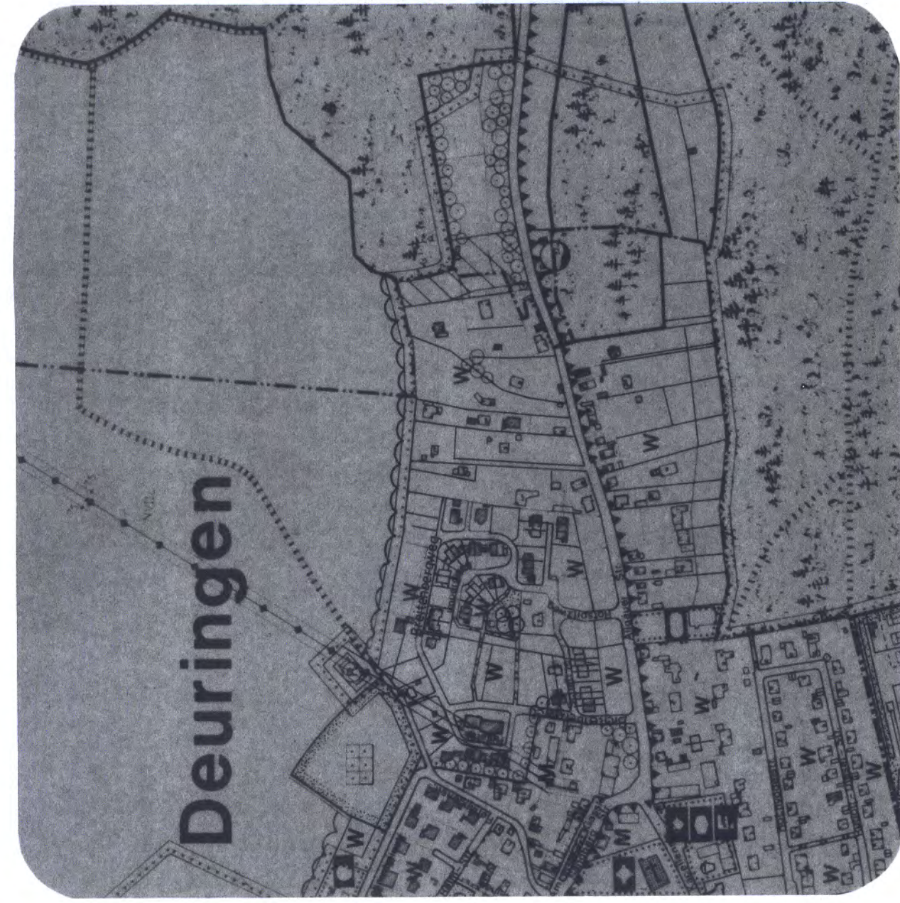
Übersichtsplan 1 : 5000 auszug flächennutzungsplan